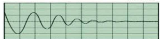
Nonkula 特許 ダンパー ホルダー 7 X D